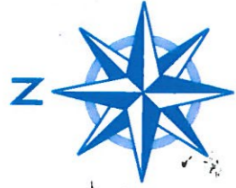
Rose des Vents