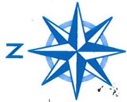
Rose des Vents